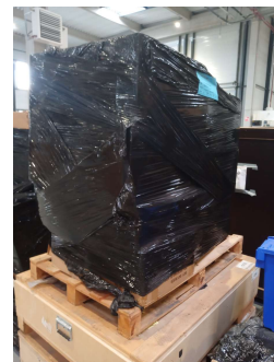
Le film n'enveloppe pas la base