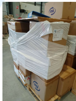
Pas assez filmée