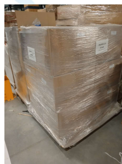
Pas de bande de garantie